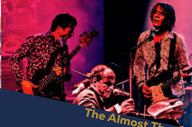
The Almost Three